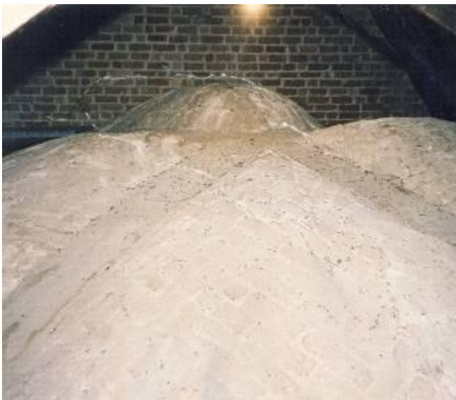
Nogle af kirkens hvælvinger, set ovenfra