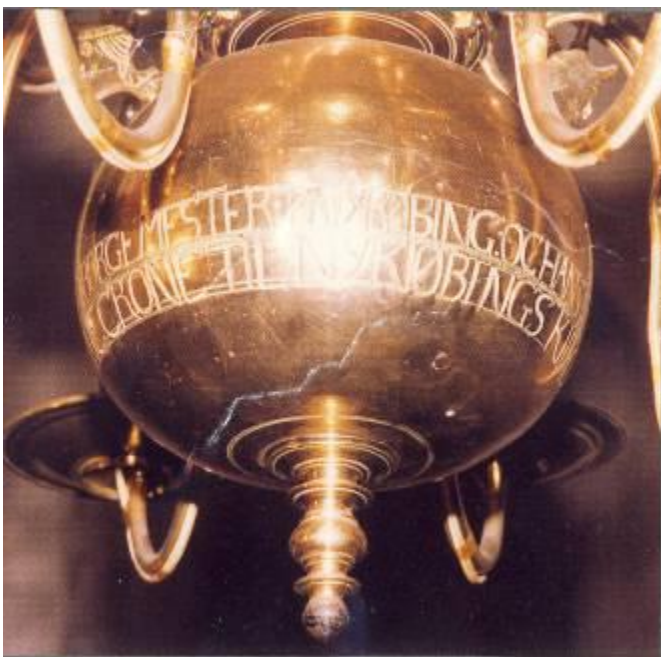
Udsnit af kirkens største lysekrone.