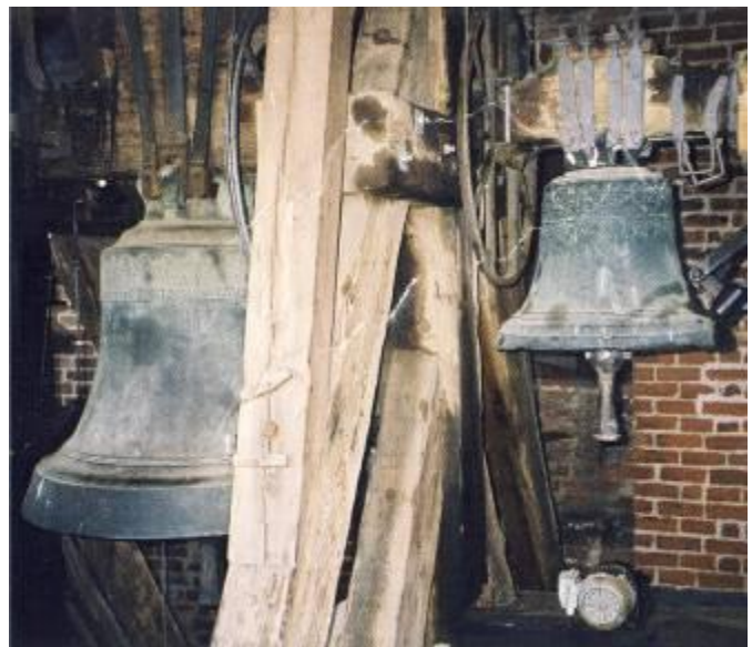
To af kirkens tre klokker.

Bygningen havde dengang romanske rundbuer, dels i åbningen mellem skib og kor, dels i murværkets vinduesåbninger og døre. Udvendig smykkedes murværket desuden af en flise af rundbuer under taggesimsen.