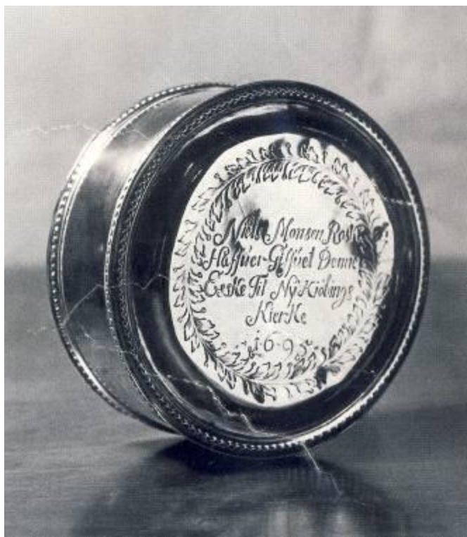
Oblatæske fra 1692

Desuden opsattes glasmalerier i korets vinduer, således som der efter alt at dømme havde været i middelalderen. Desuden fik kirken i 1994 nyt orgel, som af lydmæssige årsager nu blev placeret i hovedskibet, mens tidligere orgler havde været anbragt i sideskibet.